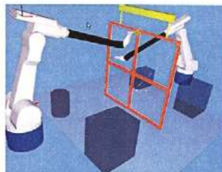
Automatyczne generowanie programu.

Moduł programowy jest dostosowywany do rzeczywistych warunków. Rowinco zaadaptować można zarówno do linii z dwoma robotami posadowionym naprzeciwko siebie, jak również do linii z jednym robotem, lakierującym najpierw jedną a potem drugą stronę okna. Lakierowane mogą być kolejno po sobie okna (konstrukcje) o różnych kształtach i wymiarach, gdyż dla każdego z nich oddzielnie generowany jest program lakierniczy.